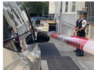
„Schreie in ganzer Nachbarschaft zu hören“:...