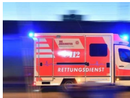
NRW: Kind (12) stirbt nach Unfall mit Rasenmäher