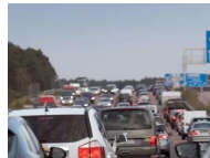
Ferienbeginn: ADAC erwartet Staus am Wochenende