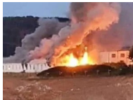
Brand in NRW-Flüchtlingsunterkunft: Bewohner...