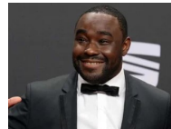
Nelson Müller: Gefahr, dass Schwarze in Opfer...