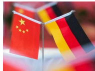
Luxusküchen-Hersteller Poggenpohl kommt in...