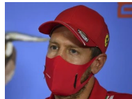
Zurück in die Zukunft? Sebastian Vettel flirtet...