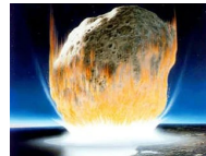
Asteroid mit Kurs auf Erde: NASA stellt Weichen...